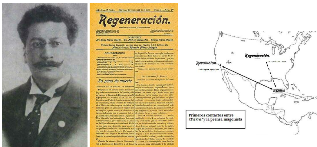
Fig. 03 – Da esquerda para direita: um retrato de Ricardo Flores Magón, a primeira página do número de estréia do Regeneración e um mapa demonstrativo da circulação do Regeneración com o periódico ¡Tierra! 3

A folha oficial do PLM circulou nas Américas (Cuba, Uruguai, Argentina e Brasil) e na Europa (Espanha, França, Inglaterra, etc.), e divulgou uma leitura radical sobre os acontecimentos revolucionários mexicanos. No caso das Américas, Cuba foi um ponto importante de distribuição do Regeneración e de divulgação, entre os anarquistas do continente americano, dessa leitura libertária da Revolução Mexicana. Da Califórnia, os membros do PLM enviavam pelo correio alguns exemplares camuflados do Regeneración , com destino a Havana, e de lá, ¡Tierra! publicava algumas informações sobre a situação mexicana em suas páginas e também, redistribuía a folha anarquista mexicana para a Espanha e outros países da América Latina.