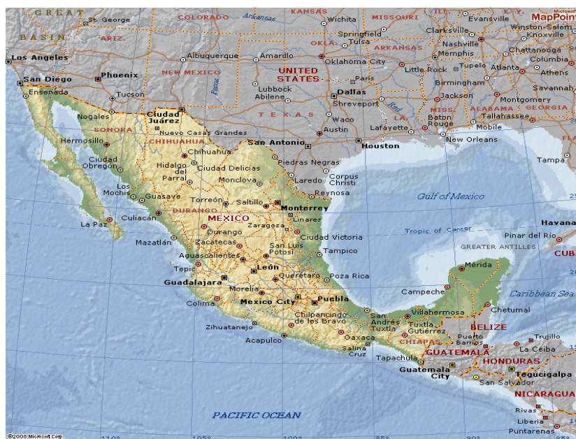
Fig. 01 – Mapa político do México

Foram eles, além de outros diversos militantes anônimos, que acompanharam a Revolução Mexicana pelas páginas da imprensa operária.