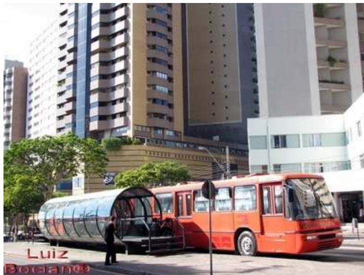
FIGURA 5 – CURITIBA – ÔNIBUS EXPRESSO