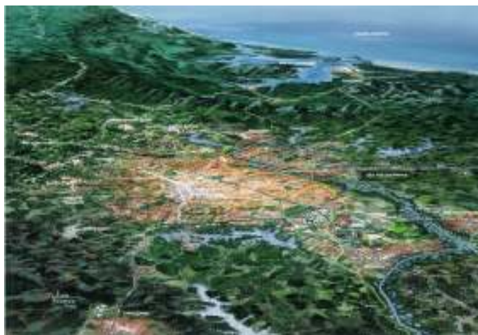
FIGURA 8 – PERSPECTIVA AÉREA DO NÚCLEO URBANO CENTRAL – NUC – NA REGIÃO METROPOLITANA DE CURITIBA – RMC

Na Figura 8 é apresentada uma perspectiva aérea da área urbanizada do NUC, que forma uma mancha antropizada contínua com partes dos territórios de vários dos 13 municípios que rodeiam Curitiba.