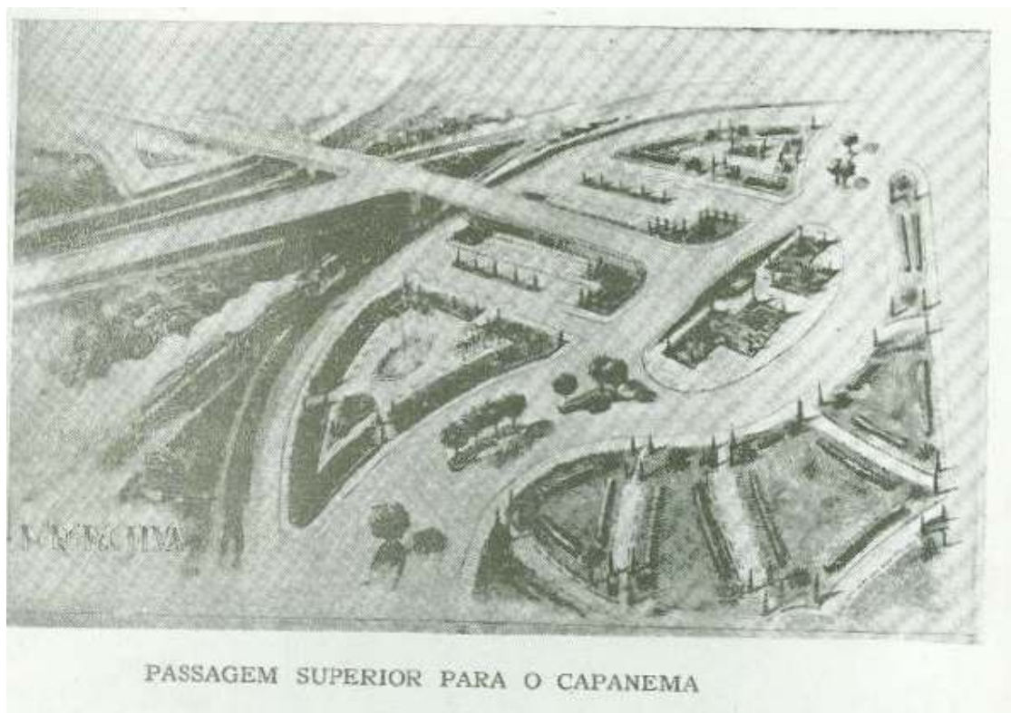
FIGURA 2 – PERSPECTIVA DE VIADUTO PREVISTO NO BAIRRO CAPANEMA – 1942 – CONSTRUÍDO NOS ANOS 1970/80