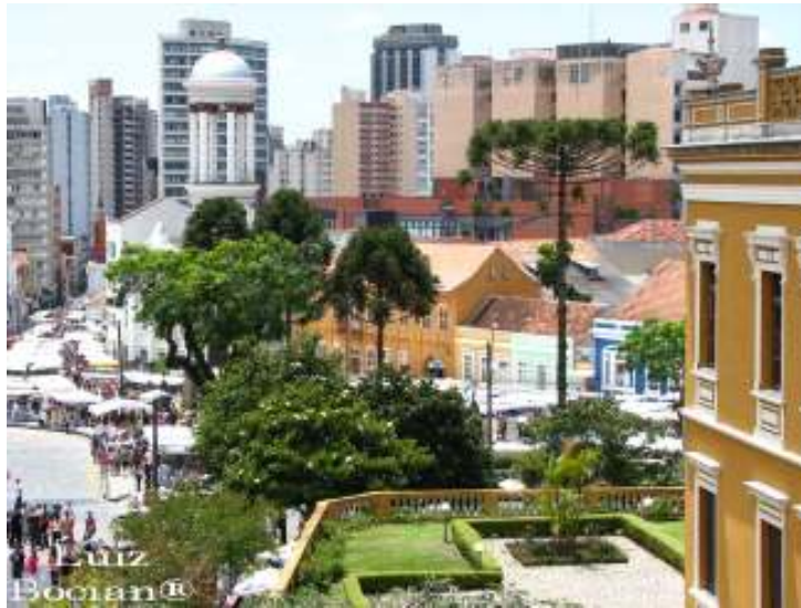
FIGURA 4 – CENTRO DE CURITIBA - VISTA DA PRAÇA GARIBALDI – SETOR HISTÓRICO E FEIRINHA DE ARTESANATO

A experiência em planejamento urbano curitibana passou a ser conhecida e divulgada, repercutindo nacional e internacionalmente como um modelo de planejamento baseado na escala humana, na busca do verde, na valorização do patrimônio histórico, em um sistema de transporte coletivo eficiente e inovador.