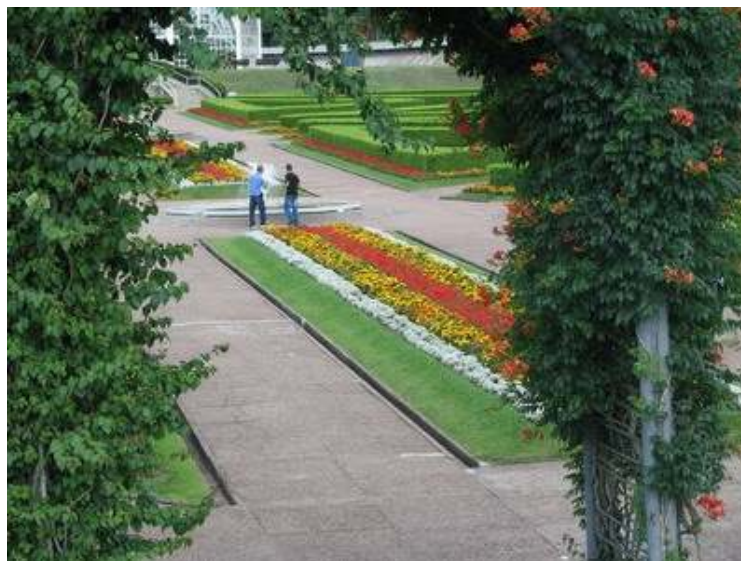
FIGURA 6 – CURITIBA – JARDIM BOTÂNICO