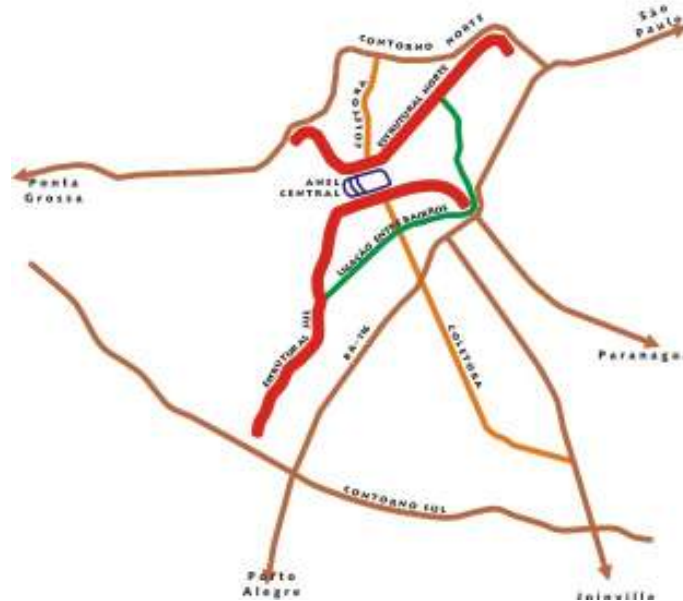
FIGURA 3 – ESQUEMA BÁSICO DO PLANO PRELIMINAR DE URBANISMO – 1965 – SISTEMA VIÁRIO